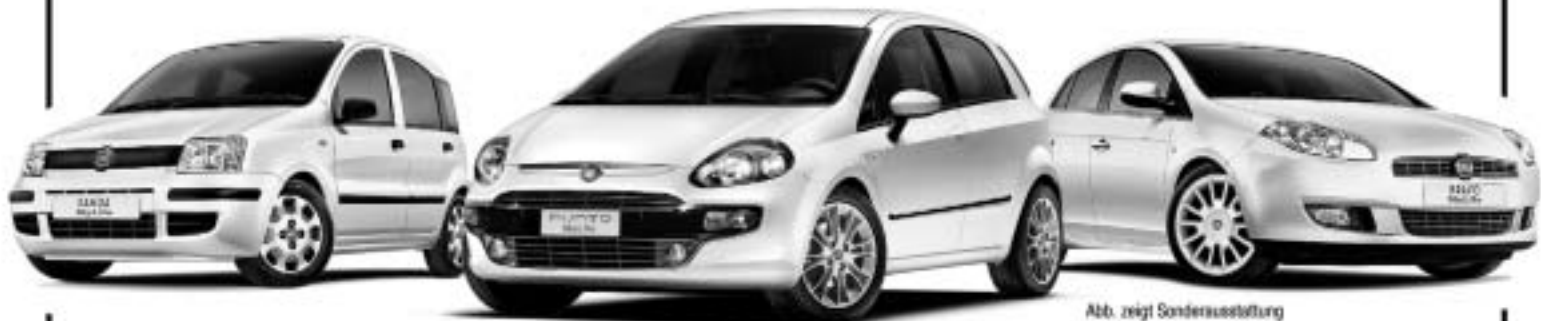
Abb. zeigt Sonderausstattung